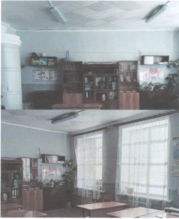
Рис.1 фото «До»